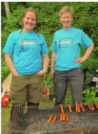
Naturmangfolddag 2011. Grong og Namsskogan kommuner passer på at ingen går sultne.

Denne årlige markeringen har utviklet seg til å bli et godt vindu for å få frem naturveiledning i media og til å knytte gode samarbeidsrelasjoner.