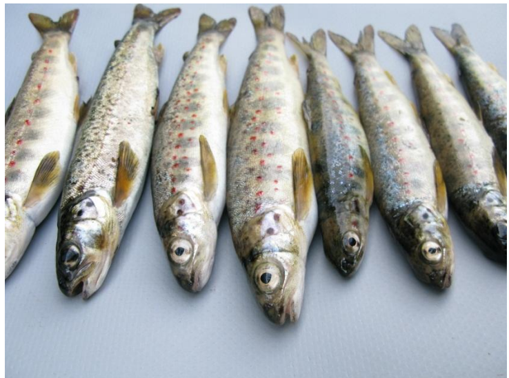
Småblanken er en europeisk sjeldenhet som finnes kun i øvre del av Namsen.

I tillegg fikk tre HiNT-studenter oppgaven med å lage en egen nettside for småblanken. Denne stod ferdig våren 2011, men har i den senere tid blitt stengt på grunn av tekniske problem og økonomisk usikkerhet knyttet til drift.